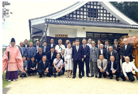
八多保育園 創立70周年記念式典 (2024.9.27)