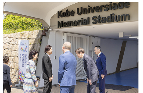
神戸2024世界パラ陸上大会 開会式 秋篠宮皇嗣殿下同妃両殿下お成り (2024.5.27)