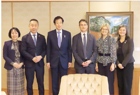
駐日オーストラリア特命全権大使