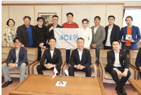
シンガポール・シティ青年会議所

外国の方々との交流は、お互いの文化を尊重しながら学び合い、自国を見つめ直す機会になります。