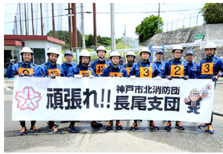
北消防団 長尾支団 2チーム 神戸市代表として 兵庫県消防操法大会出場 (2024.7.28)