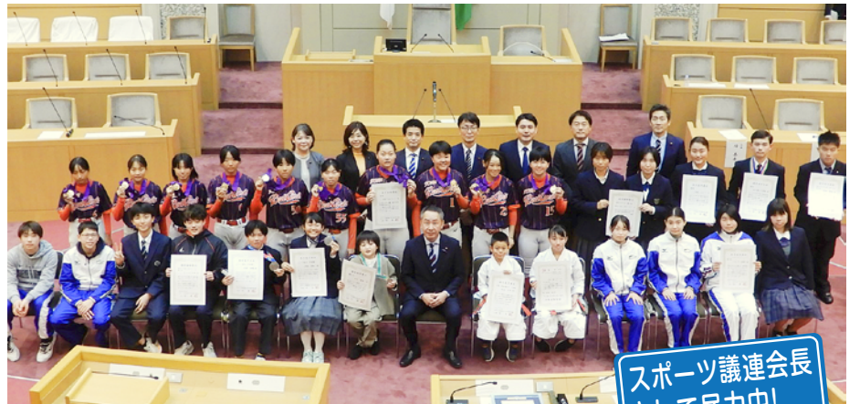
スポーツ優秀選手・団体表彰 表彰式 (2024.12.24)