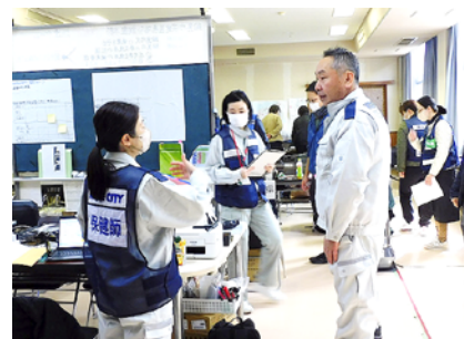
現状、問題点等の説明を受ける