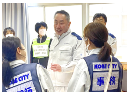
珠洲市で頑張る職員にエールを送る