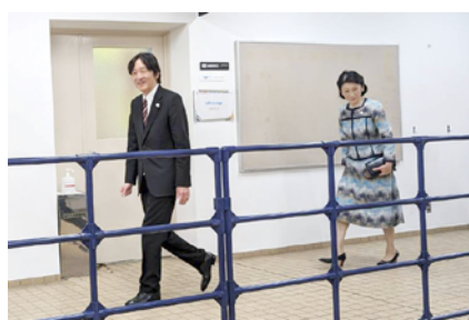
神戸2024世界パラ陸上大会 開会式 秋篠宮皇嗣殿下同妃両殿下お成り (2024.5.27)