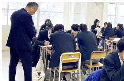
【神戸甲北高等学校での主権者教育】

日本は、戦後から投票率が下がり続け、直近の国政選挙では、5割半ばで推移し、若年層では3割台と政治離れが顕著です。こうした状況の責任は若者にあるわけではなく、真摯に主権者教育を進めてこなかったわたしたち大人にあります。働くことの意義や税や社会保険といった負担を「自分ごと」として理解し、財政健全化の重要性や、社会保障をはじめとした国民の権利や義務など国民生活を営むうえで必要な知識を蓄えてもらわなければなりません。そして自らの政治参画が、自らの人生に大きく関わっていることを実感してもらうことが大切です。