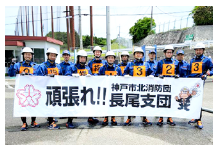
北消防団 長尾支団 2チーム 神戸市代表として 兵庫県消防操法大会出場 (2024.7.28)