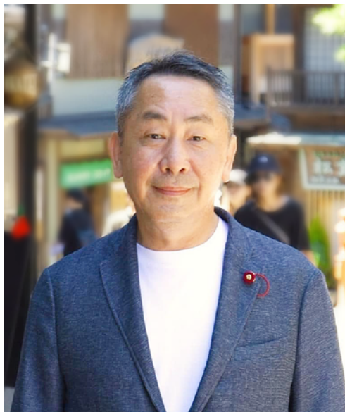
【令和6年度主な諸役】