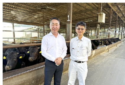
北区 50周年記念事業 (2024.2.22)