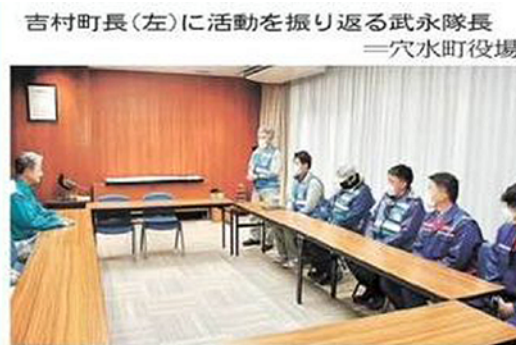
吉村町長(左)に活動を振り返る武永隊長 ＝穴水町役場