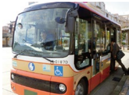
八多町コミュニティバス（はたっこバス）の本格運行

公共交通機関を利用して通学する市立小中学生の保護者に対する通学費助成を拡充 (平成27年度) 1/2 補助 → (平成30年度) 全額補助に拡充