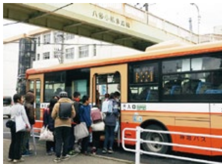
公共交通機関を利用した通学の様子